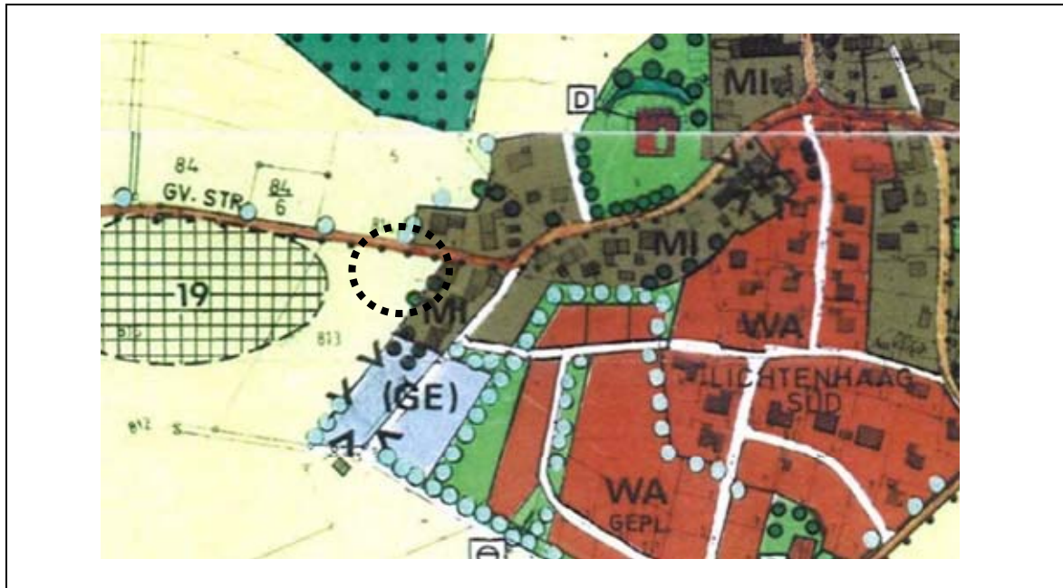
Ausschnitt aus dem Flächennutzungsplan

erlässt aufgrund des § 34 Abs. 4 Satz 1 Nr. 3 i.V.m. den §§ 3, 10 Abs. 2 und 3 und 13 Abs. 2 und 3 des Baugesetzbuches (BauGB) in der Fassung der Bekanntmachung vom 03.11.2017 (BGBl. I, S. 3634) zuletzt geändert durch Art. 2 des Gesetzes vom 04.01.2023 (BGBl. 2023 I Nr. 6), Art. 81 der Bayerischen Bauordnung (BayBO) in der Fassung der Bekanntmachung vom 14.08.2007 (GVBl. S. 588, BayRS 2132-1-B) zuletzt durch § 2 des Gesetzes vom 10. Februar 2023 (GVBl. S. 22) geändert, der Baunutzungsverordnung (BauNVO) in der Fassung der Bekanntmachung vom 21.11.2017 (BGBl. I S. 3786) zuletzt geändert durch Art. 3 des Gesetzes vom 04.01.2023 (BGBl. 2023 I Nr. 6), Art. 23 der Gemeindeordnung für den Freistaat Bayern (GO) vom 22.08.1998 (GVBl. S. 796, BayRS 2020-1-1-I) zuletzt geändert durch § 2 des Gesetzes vom 09.12.2022 (GVBl. S. 674) und der Planzeichenverordnung (PlanZV) vom 18.12.1990 (BGBl. 1991 I S. 58) zuletzt geändert durch Art. 3 des Gesetzes vom 04.06.2021 (BGBl. I 1802) folgende Einbeziehungssatzung: